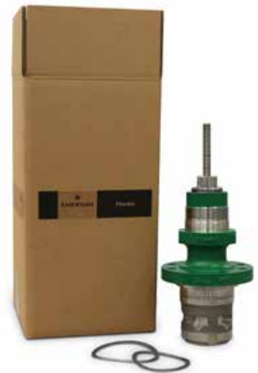
Fisher Originalteile... Immer zuverlässig

Das Liefersystem für Regelventilteile von Fisher ist erprobt und bewährt. Es wurde entwickelt, um Ihnen das richtige Teil zur richtigen Zeit zu einem beliebigen Standort überall auf der Welt zu liefern, so dass Sie ungestört weiterarbeiten können, während Sie Ausfallzeiten minimieren. Emerson hat in ein globales Netzwerk aus Vertriebsbüros, regionalen Produktionsanlagen, Ersatzteillagern und Serviceeinrichtungen investiert. Nutzen Sie diese, um Ihre Ausfallzeiten mit schnellem Zugriff auf Fisher-Originalteile und Emerson Lifecycle-Serviceleistungen zu minimieren.