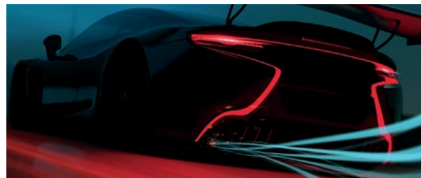
Fonctionnement de la technologie de soudure propre par vibration